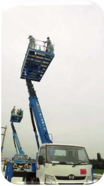
【模型による床版工事の実演】